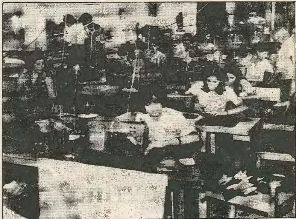
Το προχωρούν κάθε 1 λεπτό. Έτσι αν τι κάνουν με 40 κομμάτια την ώρα κάνουν με 60. Σκοτώνουμε στο ράφιο. Εγώ για να γλυτώσω τις φωνές κάθομαι να διδάξομαι και συμπληρώνω τα καθυστερημένα ή διορ-

«Πιάνω £23,500. την εβδομάδα. Όταν σχολάζω είμαι πεθωμένη από την κούραση. Ούτε τα χέρια, ούτε την μέση μου νοιώθω. Αν δεν είχα τόση ανάγκη θα τα παρατούσα από καιρο. Όλο φωνές και απειλές ακούμε όλη μέρα. Αλμοίμονο σου αν δεν παραδώσεις τα κομμάτια που θέλουν κάθε μέρα ή αν κείνεις λάθος